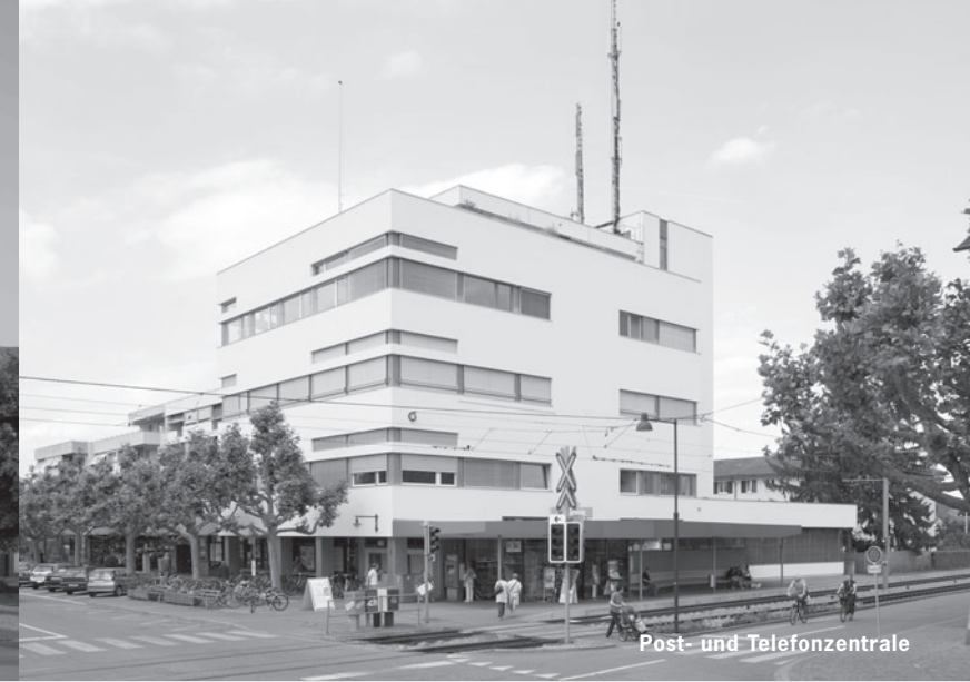
Post- und Telefonzentrale