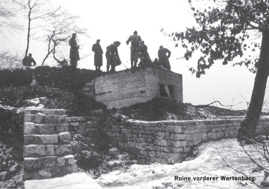
Ruine vorderer Wartenberg