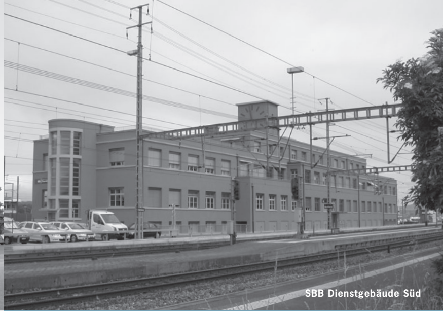
SBB Dienstgebäude Süd