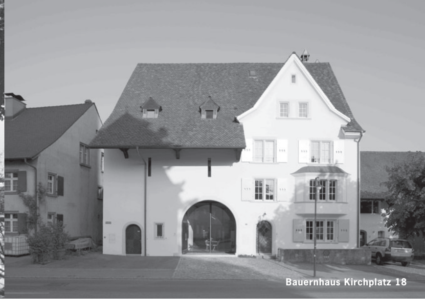
Bauernhaus Kirchplatz 18